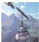
Zementtransportseilbahn Baden, CH