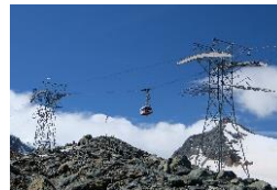
Klein Matterhorn, CH