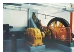
Diverse Antriebs- und Windenprojekte