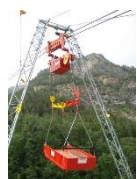
Materialseilbahn Jungbach, CH