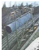
Spezialstandseilbahn Brusio, CH