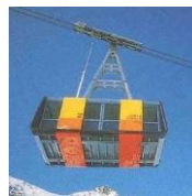
Cime de caron, FR